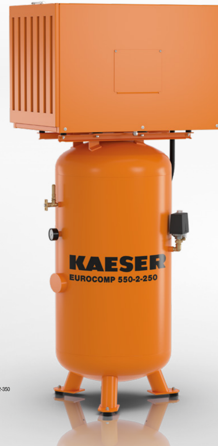
Abb.: EPC 550-2-350

Hohe Qualität für eine lange Lebensdauer