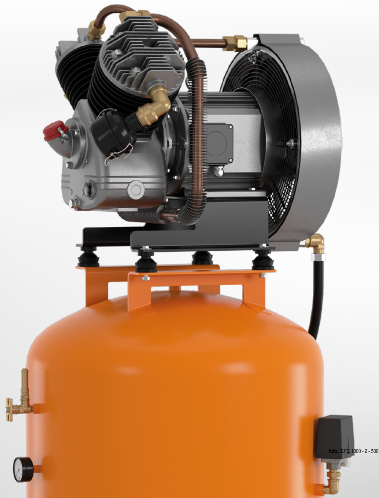
Abb.: EPC 1000 - 2 - 500